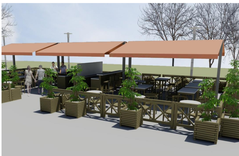
Wizualizacja ogródków gastronomicznych