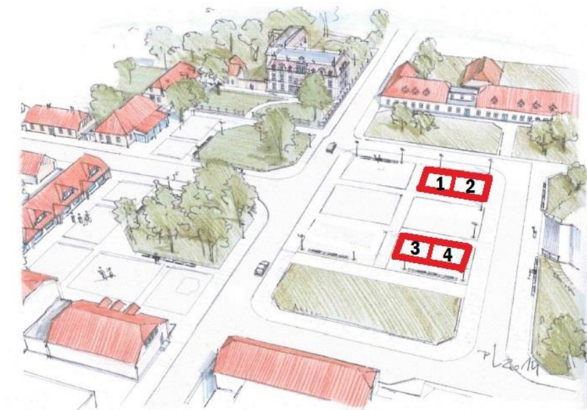
Lokalizacja ogródków gastronomicznych